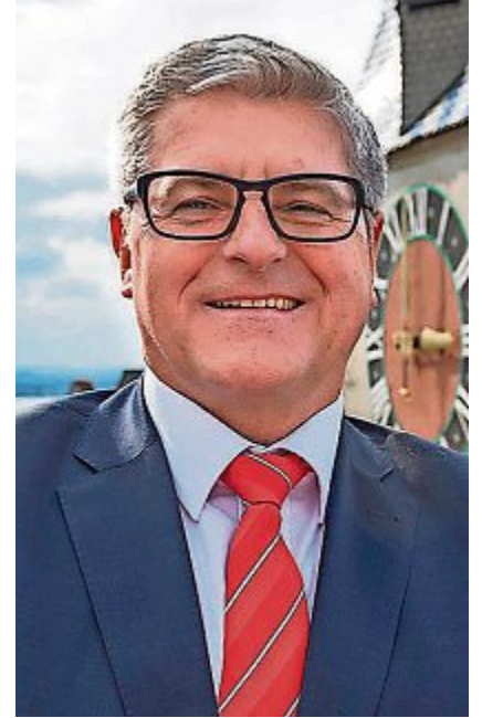
Hugo Halter, Bürger, Top-Politiker und Polizist mit Leib und Seele.