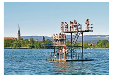
Der Zugersee ist nicht der einzige Grund, warum es sich durchaus lohnt im Sommer hier in Zug zu bleiben.

Das Waldstock Open Air wird in Steinhausen vom 31. Juli bis zum 3. August mit der 20-jährigen Jubiläumsausgabe für Spektakel sorgen. Am 1. August laden die Gemeinden des Kanton Zugs zu den jeweiligen Bundesfeiern ein (siehe Ausgabe vom 24. Juli). Ein weiteres Highlight wird das Eidgenössische Schwing- und Älplerfest vom 23. bis zum 25. August sein. Das Festgelände, wie auch der Gabentempel sind kostenlos zugänglich.