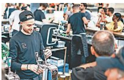
Eröffnungsfeier: 9. und 10. August!