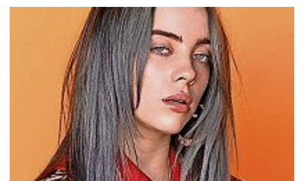
Billie Eilishs Sound ist einzigartig.

Ihr Sound ist am Puls der Zeit. Mit Songs wie «bad guy» begeistert sie die Massen. Die Rede ist von Billie Eilish.