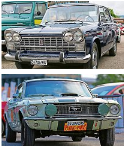
Das Wochenende vom 3. und 4. August hat für Autofans einiges zu bieten. z.Vg.

Doch nicht nur Mustangfans kommen auf ihre Kosten, denn Bands wie BluesZug, die Swiss Wörker Musig VolXRox, und Jonny Trouble treten auf und unterhalten alle Gäste