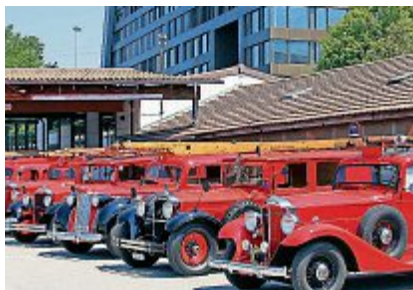
Tolle Vorkriegsfahrzeuge warten auf die Besucher.

Am Sonntag, 9. September 2018, 9:30 Uhr, gibt es in den Stierenstellungen von Zug bereits das Saisonfinale der Oldtimersaison 2018 von Zug. Wir erwarten wieder schönes Wetter und 800 Oldtimer, Autos, Motorräder und Nutzfahrzeuge aller Marken.