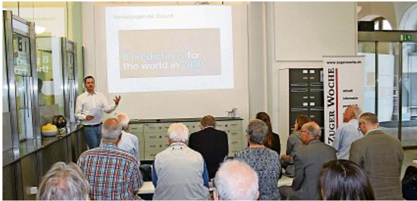
Die Diskussions- und Denkplattform «First Friday» geht am kommenden Freitag, 7. September auf Exkursion im Zuger Wald. z.V.g.

Erstmals diskutiert man bei der Diskussionsplattform «First Friday» nicht drinnen, sondern unter freiem Himmel. Ausgangspunkt der Exkursion ist die ZVB-Haltestelle Klinik Zugersee oberhalb Oberwil. Auf guten Naturstrassen wandert man hinauf zur Schöneegg. Die reine Wanderzeit beträgt 45 Minuten. Es